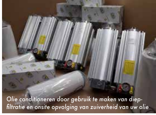
Olie conditioneren door gebruik te maken van diep-filtratie en onsite opvolging van zuiverheid van uw olie